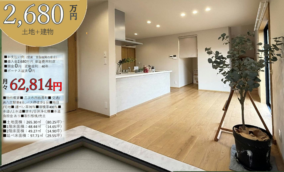
Kitchen & Dining